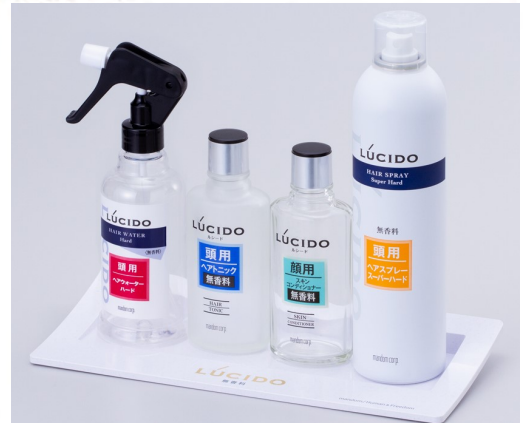
「ルシード・ヘアスタイリングシリーズ」 専用トレイ (W285mm×D125mm)