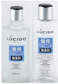
ヘアトニック用 (125mlガラス)(150ml樹脂)

※キャップはネジ有り、ネジ無しの2タイプが選べます。(樹脂容器のキャップはネジ無しのみになります。)