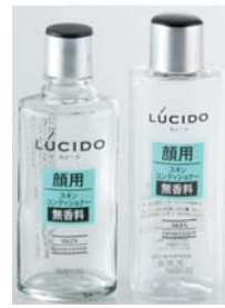
スキンコンディショナー用 (125mlガラス)(150ml樹脂)