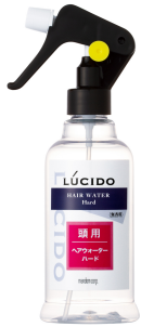
スタイリングウォーター用 (250ml)