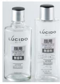
アフターシェーブローション用 (125mlガラス)(150ml樹脂)