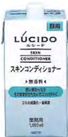
スキンコンディショナー 1,000ml