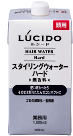
スタイリングウォーター(ハード) 1,000ml