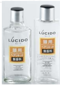
ヘアリキッド用 (125mlガラス)(150ml樹脂)