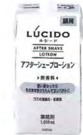
アフターシェーブローション 1,000ml